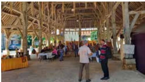
11 septembre - Fête gauloise