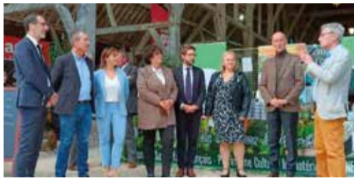
24-25 septembre - Salon remarquable du goût