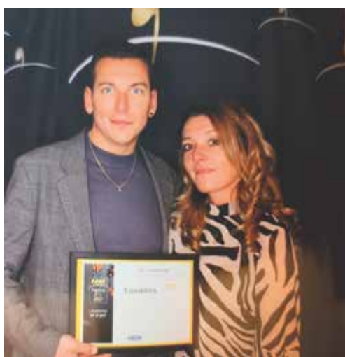
Bravo à notre boucherie Côte et Bœuf 3 PAPILLES D'OR