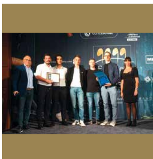
Bravo à notre traiteur Instants Traiteur 4 PAPILLES D'OR