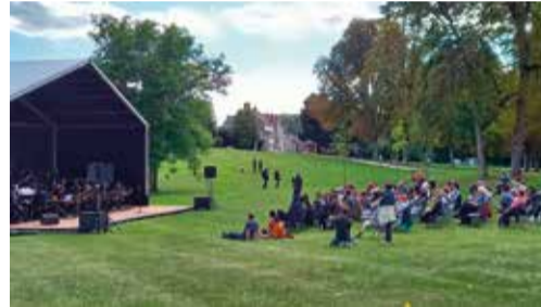
18 septembre - Journée du Patrimoine