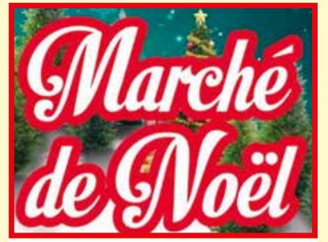
Programme du 11 novembre

Le marché de Noël de Méréville aura lieu le week-end des 26 et 27 novembre prochains à la salle des fêtes rue Jules Ferry. L'UCAM, Association des Commerçants de Méréville, aura le plaisir de vous y accueillir nombreux. Différents stands et animations vous seront proposés de 10h à 18h.