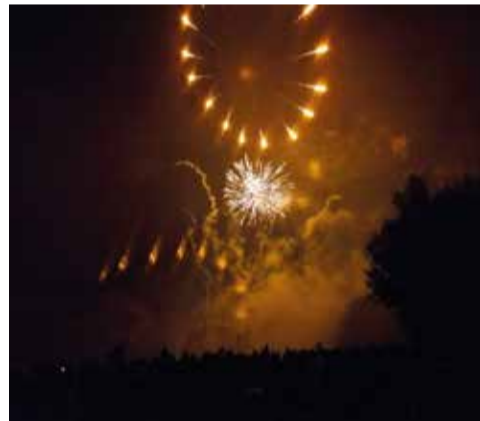
Grand feu d'artifice au Parc du Domaine départemental de Méréville.