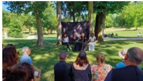
2 juillet - Les Traverses