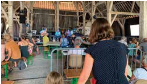
18 juin - Halle in Blue Jazz à Méréville