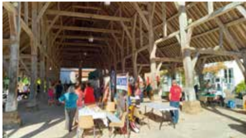
4 septembre - Fête des Associations