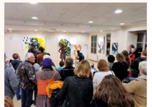
Vernissage de l'exposition "MERCII"