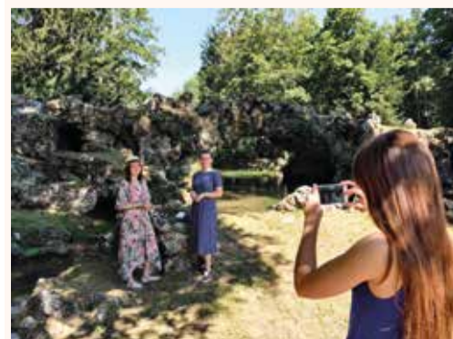
Tournage de la vidéo sur le Pont de Roches

Vous pouvez réserver sur place auprès de l'équipe du Centre Culturel, par téléphone au 01 64 95 43 31 ou bien envoyer un mail à centreculturel.mereville@caese.fr .