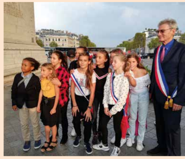
Le conseil des enfants

Nous remercions les organisateurs pour cet agréable moment.